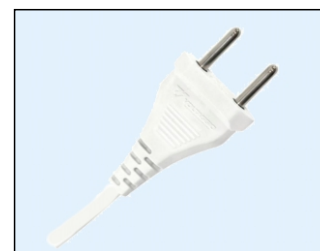
Plug Padrao NBR